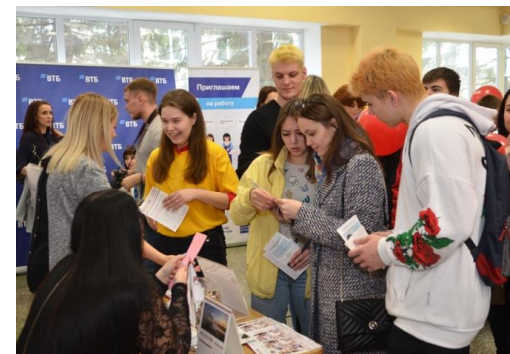
ДНИ КАРЬЕРЫ, ЯРМАРКИ ВАКАНСИЙ