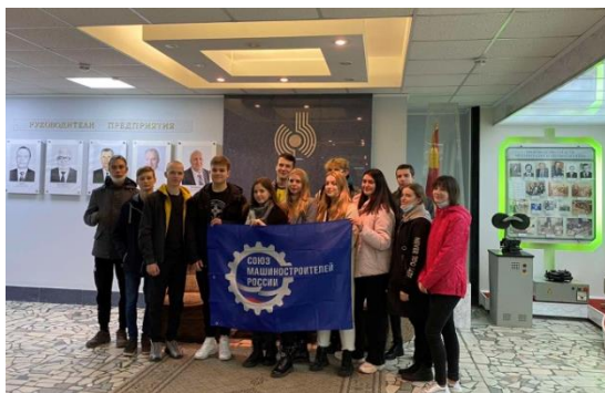
ВСЕРОССИЙСКАЯ АКЦИЯ «НЕДЕЛЯ БЕЗ ТУРНИКЕТОВ»