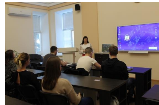
АДАПТАЦИЯ К РЫНКУ ТРУДА (ТРЕНИНГИ ПО ЭФФЕКТИВНОЙ САМОПРЕЗЕНТАЦИИ)