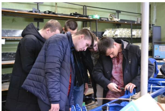
КАРЬЕРНОЕ ОРИЕНТИРОВАНИЕ (ЭКСПУРСИИ НА ПРЕДПРИЯТИЯ)