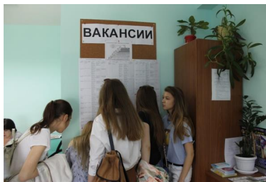
СОДЕЙСТВИЕ ТРУДОУСТРОЙСТВУ (ПОДБОР ВАКАНСИЙ)